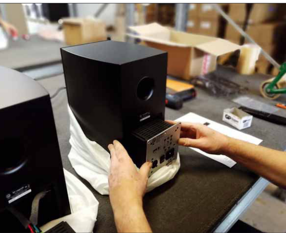
Auch der kompakte Regallautsprecher SA 5 Legend ist als aktive „Silverback-Version“ erhältlich

räte unterschiedlicher Hersteller senden bereits nach dem WiSA-Standard, idealerweise greift man jedoch auf den hauseigenen Wireless Hub zu, welcher im „großen“ Paket der SA 40 Legend Silverback bereits enthalten ist. Dieser kleine, schwarze Kasten sendet die Signale aller angeschlossenen Quellen kabellos an die SA 40 und kann auch ins heimische Netzwerk eingebunden werden. Spotify Connect ist bereits im Hub integriert, auch DLNA-fähige Geräte werden unterstützt. Analoge und digitale Inputs sind ausreichend vorhanden, eine HDMI-Buchse lässt sogar den Anschluss eines TV-Geräts (ARC) zu. Auch via Bluetooth lassen sich Musikdaten vom Smartphone zum Hub übertragen. Kurz und gut: Was will man mehr?