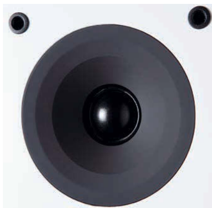
▲ Der in einem Trichter sitzende Hochtöner soll für besonders breite Abstrahlung sorgen.

für System Audio angefertigte Spezialität. Sinnvolles Zubehör für die Fälle, wo besonders wenig Platz gegeben ist, bieten die Dänen in Form einer Wandhalterung ebenfalls an. Klanglich ließ auch der zweite dänische Lautsprecher im Testfeld nichts anbrennen, eine so weite Raumabbildung wie bei „When I Feel The Sea Beneath My Soul“ von Tiny Island hatte kein anderer Testteilnehmer zu bieten. Im Bass etwas weicher abgestimmt, vermochte sie rundherum zu begeistern. Ein feines, kompaktes Klangmöbel!